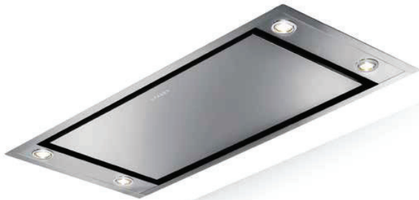
Uscita aria orientabile in 4 posizioni Air outlet adjustable in 4 positions