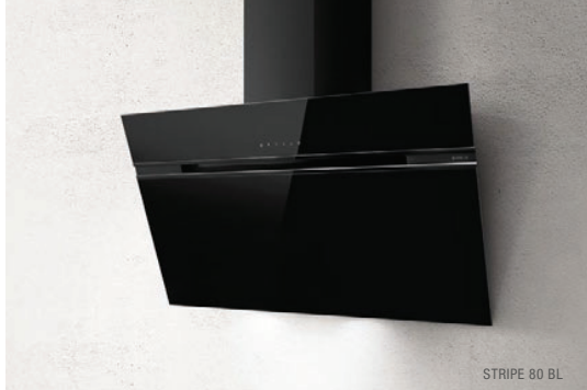
STRIPE 80 BL