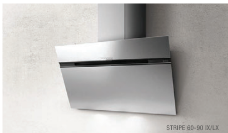
STRIPE 60-90 IX/LX