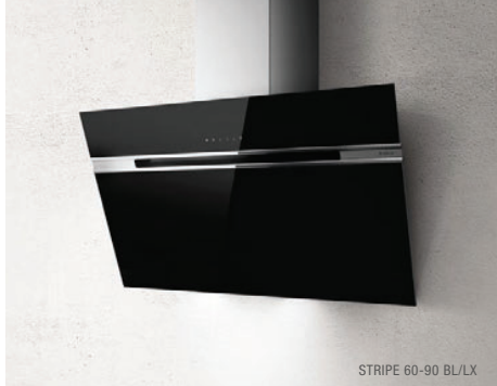
STRIPE 60-90 BL/LX