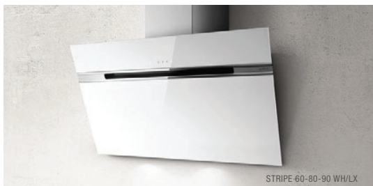
STRIPE 60-80-90 WH/LX