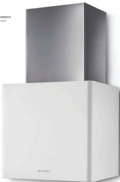
Bianco opaco White matt