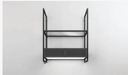
OPEN SUITE BL/F/80 PRF0166703 Module hotte + 1 étagère en verre clair (80cm) Afzuigmodule + 1 legplank van transparant glas (80 cm)