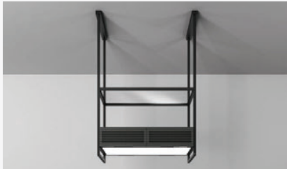
OPEN SUITE SUPERIOR BL/F/80 PRF0165965 Module hotte + 1 étagère en verre clair (80cm) Afzuigmodule + 1 legplank van transparant glas (80 cm)