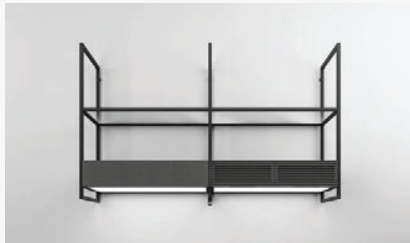
OPEN SUITE BL/F/160 PRF0167007 1 module hotte + 1 module éclairage + 2 étagères en verre clair (160cm) 1 afzuigmodule + 1 verlichtingsmodule + 2 legplanken van transparant glas (160 cm)