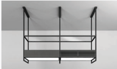
OPEN SUITE SUPERIOR BL/F/160 PRF0166771 1 module hotte + 1 module éclairage + 2 étagères en verre clair (160cm) 1 afzuigmodule + 1 verlichtingsmodule + 2 legplanken van transparant glas (160 cm)